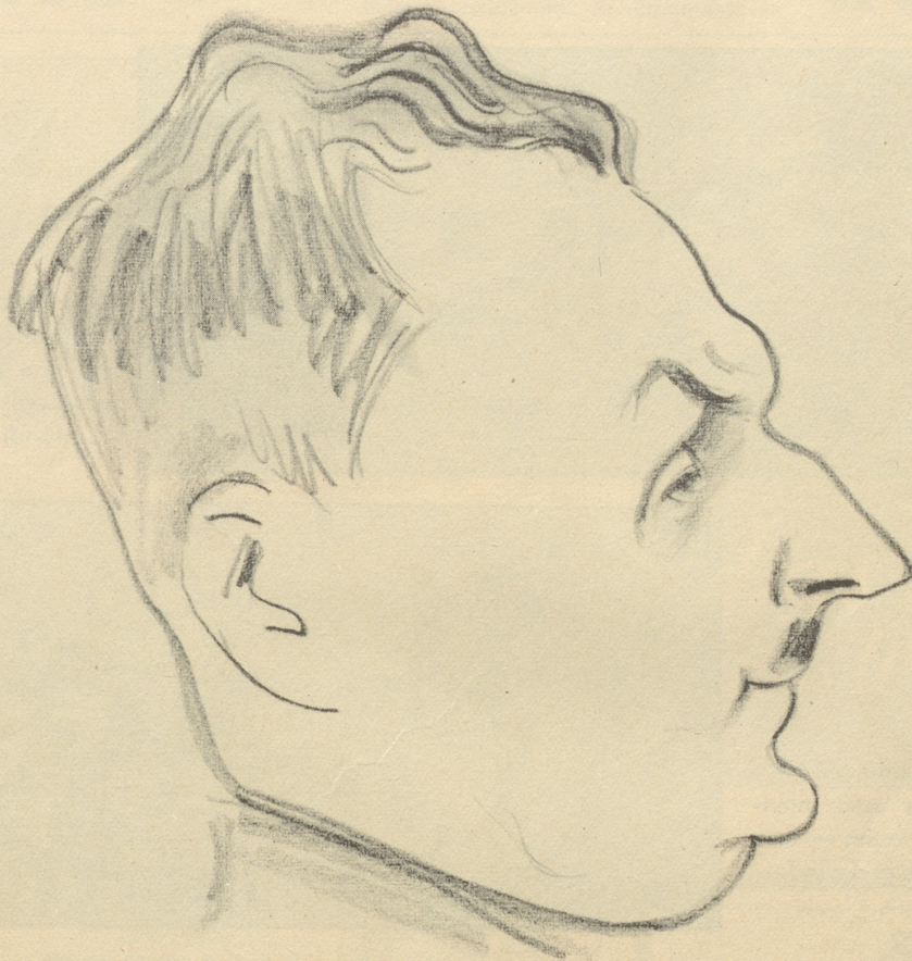
Schweizerische Parlamentarier in der Karikatur: Nationalrat Robert Bratschi, Bern