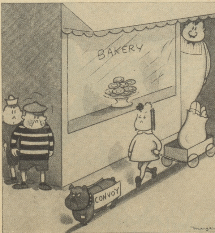
Aus einem amerikanischen Journal

«Ach, nein, ich habe mir gedacht: Steuwerdeß auf einem Bomber.» (Time)