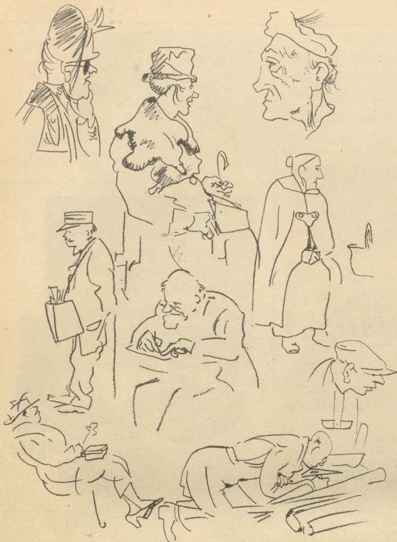
Aus Rickenbachs Skizzenbuch