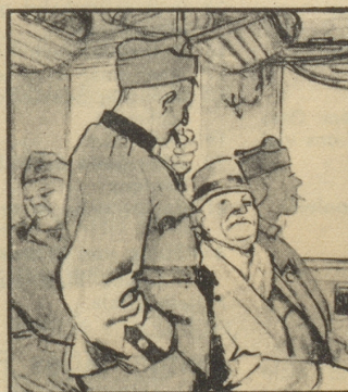
„Mich wundert nur, dass Ihr in dem Rauch singen könnt, ich werde stockheiser.“ – „Dafür nehmen wir Gaba, das lernt man beim Militär.“