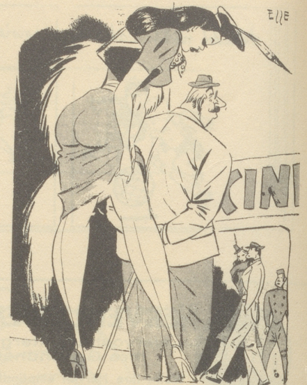
«Oh, der brave Alte! So sieht mich doch niemand - ausgenommen die Nebelspalter-Leser!» ... «420, Florenz»