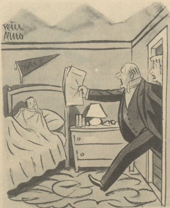
Wär isch jez wieder das Fröilein Henggeler, und was heißt das: „Puzzi“?

«Ja hesch, für so öppis bruchts Zyt, und die hanich ebe nüd.»