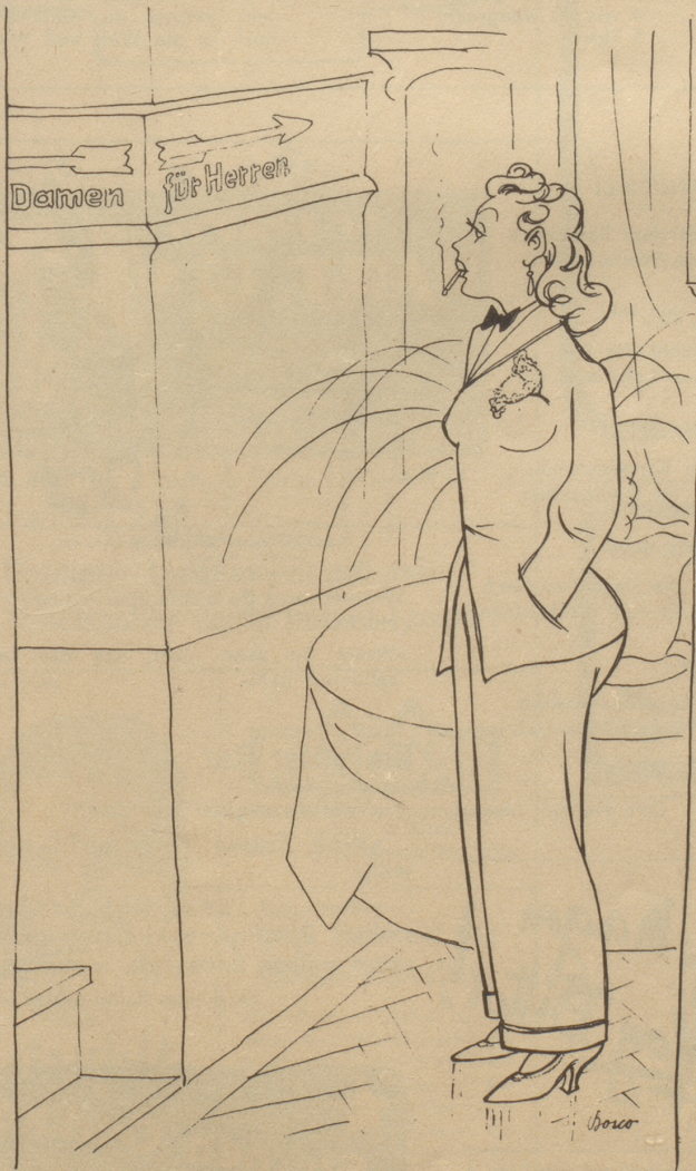
Dilemma im Hotel

«In dieser Bar sind die Tische immer reserviert, aber das Publikum ist es nie.»