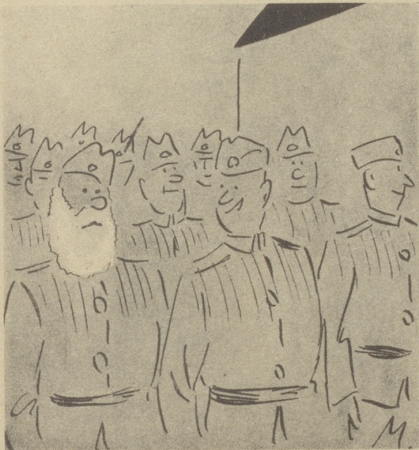
«Ich hatte mich gerade eingeseift, als der Befehl zum Antreten kam.» Söndagsnisse-Strix