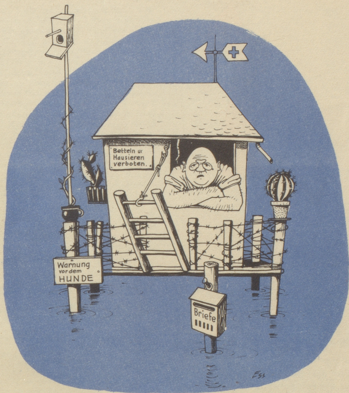
Des Egoisten Spezial-Reduit