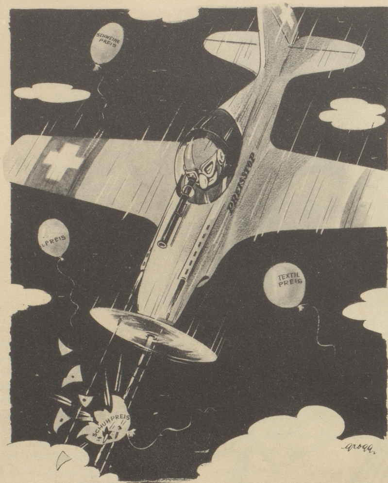
Preisstop im Schuhgewerbe