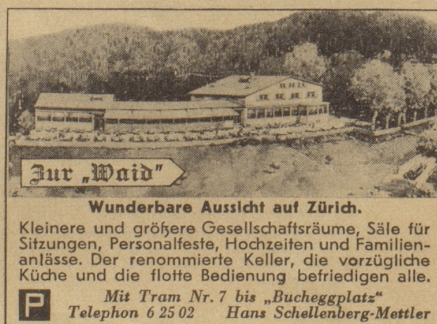
Wunderbare Aussicht auf Zürich.