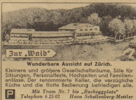
Wunderbare Aussicht auf Zürich.

Generaldépôt für die Schweiz: Jean Haecy Import A.-G., Basel