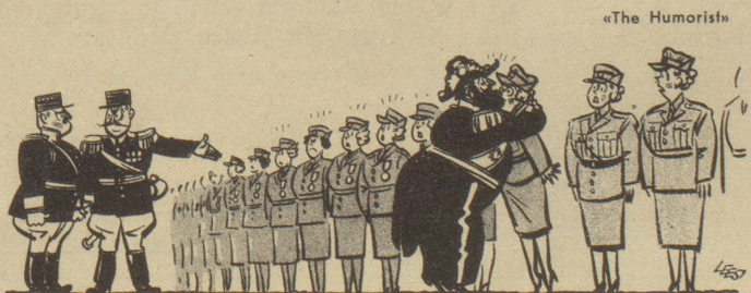
„Und morgen will er erst noch den Krankenschwesternstab dekorieren!“

Die ersten Buchstaben (von oben nach unten) und die letzten Buchstaben (von unten nach oben) ergeben den Text: «Hamster schaden genau so wie Verschwender!»