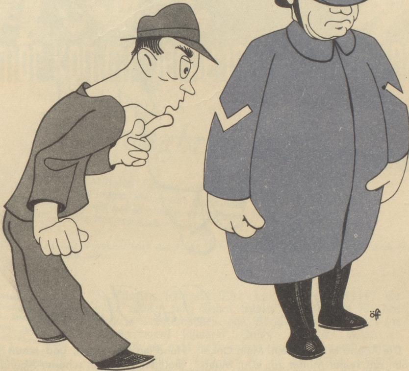
Die sonderbaren Gradabzeichen der Basler Polizei!

„Isch etz ächt das e Verkehrspolizischt oder e V-Propagischt??“