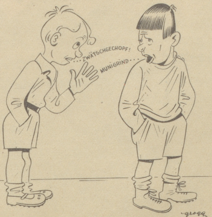
Nüd bekannt! Wowoll!

Der «Bund für Schwyzertütsch» stellt fest, daß der Jugend die Dialektausdrücke auch für die üblichsten Pflanzen- und Tierbezeichnungen vielfach nicht mehr bekannt sind.