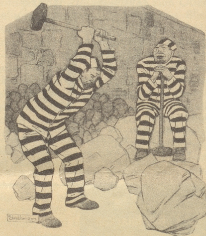
«Wenn wir jetzt draußen wären, hätten wir wahrscheinlich keine Arbeit.» Life