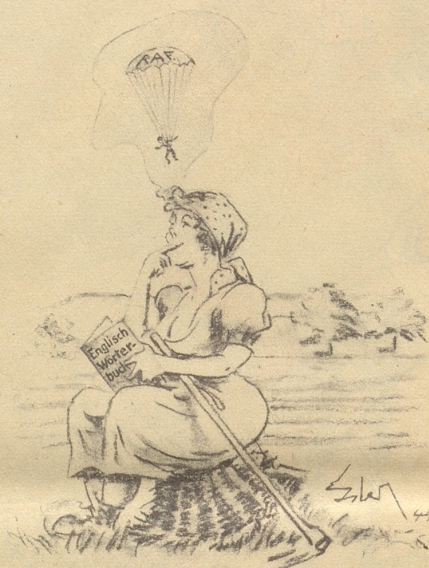
's Babettli tuet sich uf Eventualitäre vorbereite!

Das KIA, Sektion Oele und Fette, Abteilung für Druckerschwärze, möge hier einmal eines seiner Machtworte sprechen. AbisZ