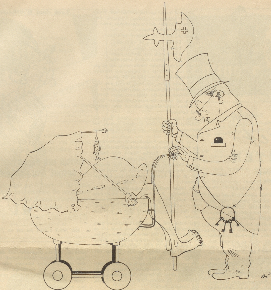
Der Schulrat von Rorschach hat den Jugendlichen, die das 18. Altersjahr noch nicht vollendet haben, den Besuch des Schweizerfilmes „Marie Louise“ nicht gestattet.

So löst ein Städtlein die Erziehungsfragen Und sämtliche Probleme punkto Kind, Ein Schulrat wacht an jedem Stubenwagen Bis unsere Babys ausgewachsen sind.