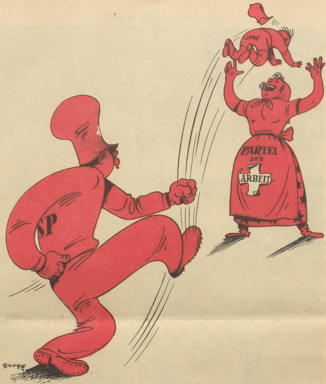
Zur Fusion der ausgestoßenen sozialdemokratischen „Linken“ mit der Partei der Arbeit.