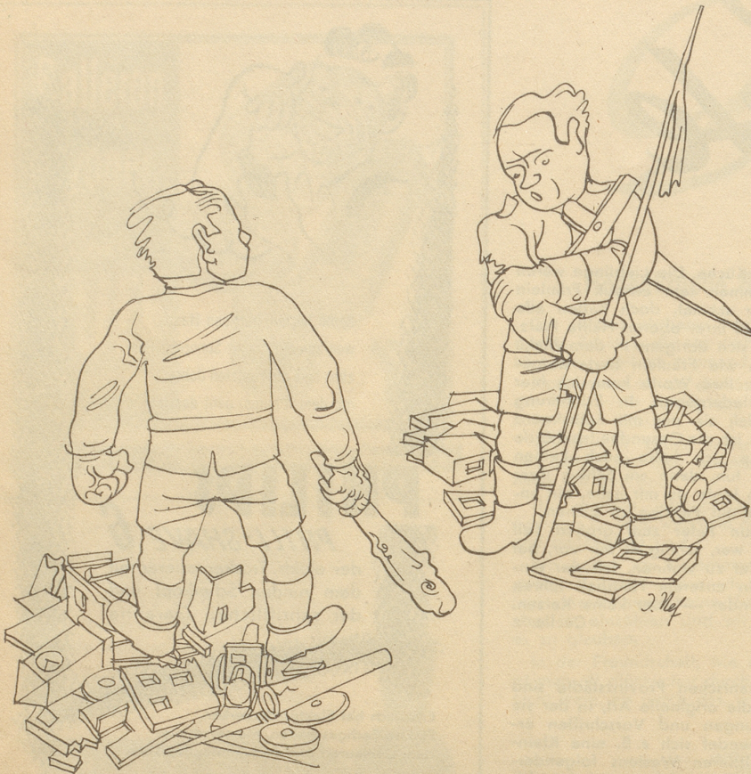
Ein Siegesdenkmal wird abbestellt.

„Du häsch putzt, aber ich cha mir defür Chöschte schpäre!“