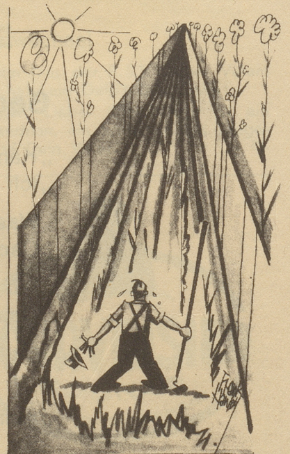
... im August, beim Jäten