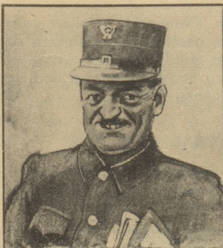
Der Briefträger ist gut Freund mit seinem ganzen Bezirk; er kennt alle und alle kennen ihn.

«Sowieso, aber num einisch ume-tanzet, e Whisky gno u grad wieder gange.» Tok