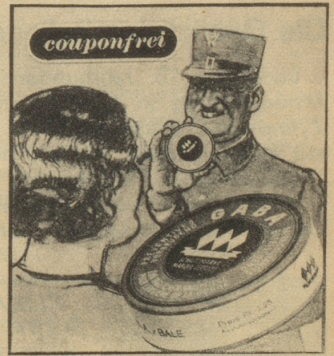
„Oh, ich habe immer eine Schachtel Gaba bei mir; Sie sollten auch Gaba im Haus haben, gerade in dieser Jahreszeit, denn Gaba beugt vor.“