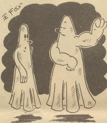
Geister unter sich „Sehen Sie, solche Muskeln bekommt man vom vielen Tischrücken!“

Lass' Dich von Sorgen nur nicht foppen und nimm im „Central“ Deinen Schoppen.