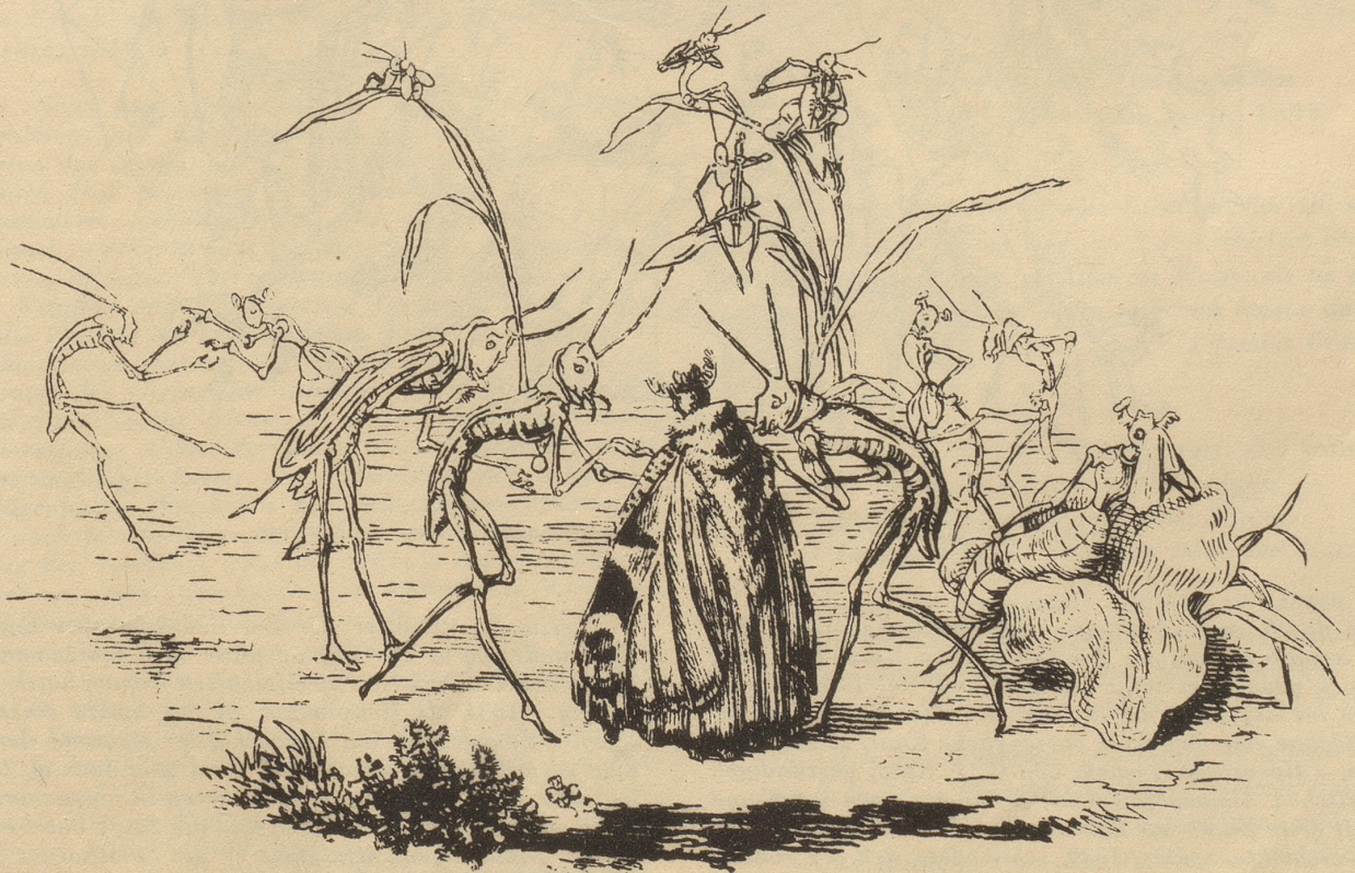
Ballsszene, Federzeichnung, Kunstmuseum Solothurn.

man im feinen und sicheren Strich Distelis etwas von der Zeichnung des Illustrators der Nibelungen. Allerdings, dessen oft spröden, trocken wirkenden Historismus wußte der aggressive Solothurner ins Saftige, Lebensvolle und Volkstümliche umzuformen, die höfische Distanziertheit ersetzte