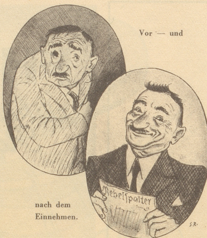
nach dem Einnehmen.

«Nein», entgegnete der König, «sie wird größer sein, — denn sie wird länger bestehen.» (Deutsch von E. W.)