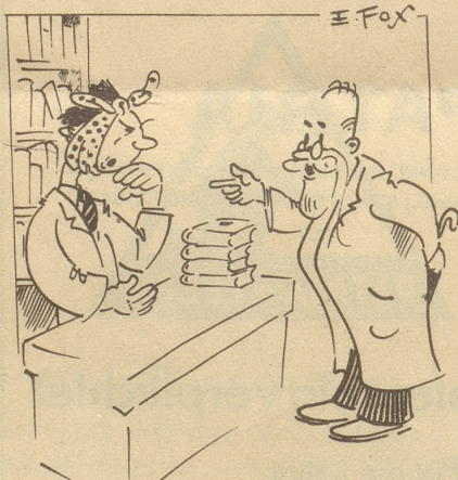
Im Bücherladen «Haben Sie Schopenhauer?» «Nein, Zahnweh!»

Auflösung: Imene freie Land dörf me no sini Meinig säge!