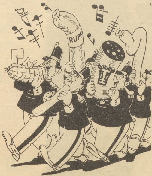
Die Hofkapelle im Schlaraffenland