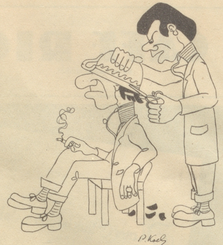
Das Neueste, der Guillotineschnitt, auch der Laie lernt ihn leicht

1 3 5 7 11 15 20 24 28 30 32 2 4 6 8 12 16 21 25 29 31 33 9 13 17 22 26 10 14 18 23 27 19