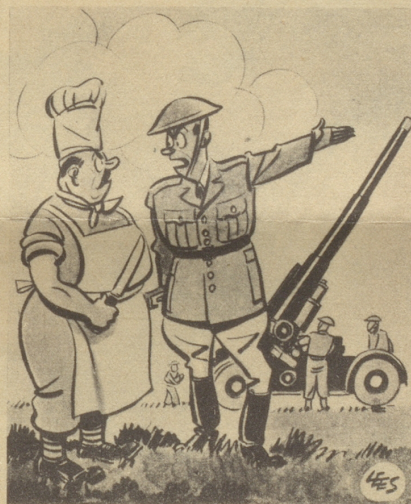
«Wildenten schießen, das geht noch; aber Hasen - so weit herunter läßt sie sich nicht.» (London Opinion)

(aus dem Amerikanischen übers. von -ert)