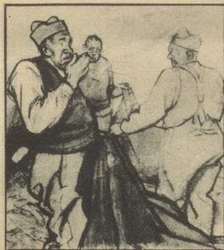
Und nun beginnt das übliche Morgen — Hust-Konzert — fast so unvermeidlich wie der weckende Korporal. Das kommt natürlich von dem langweiligen Strohstaub!