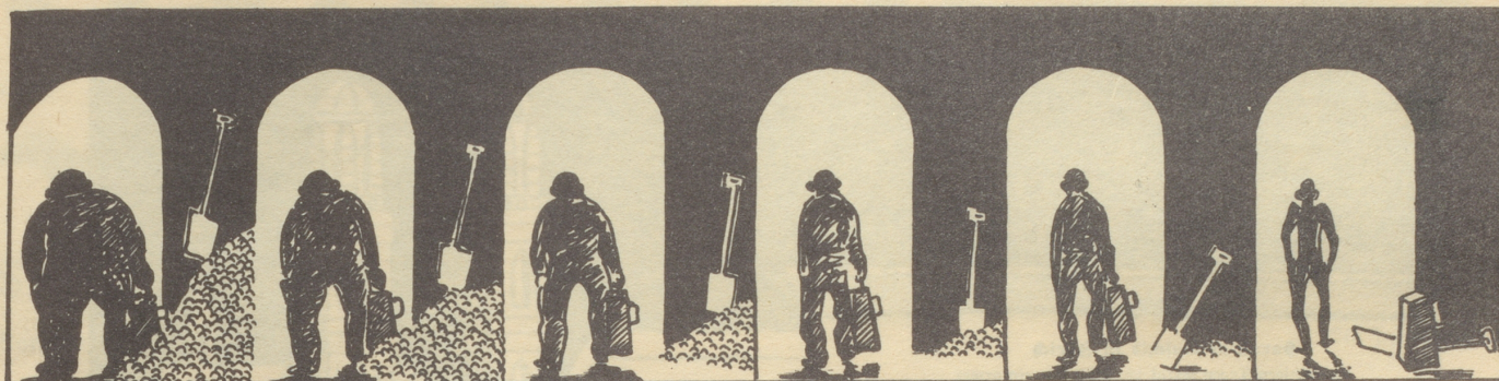
1939—1944 Bilder ohne Worte