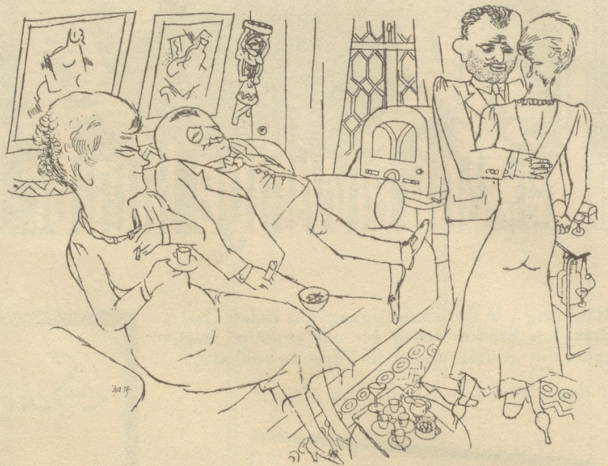
„Sehen Sie, ich ziehe Grammophon und Radio vor, da wird man nicht durch den Anblick häßlicher Musiker abgelenkt.“