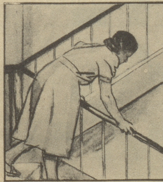
„Ist denn Ihrer auch noch nicht daheim? Bei dem schlechten Wetter holen sie sich gleich den Husten!“