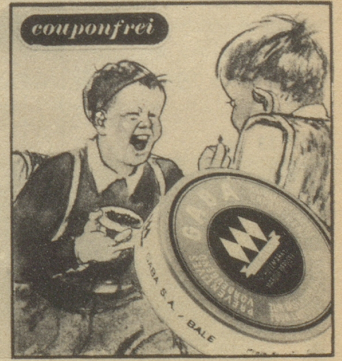
„Keine Angst, ich gebe dem Buben immer Gaba auf den Schulweg mit. Gaba schützt vor Husten und Heiserkeit.“