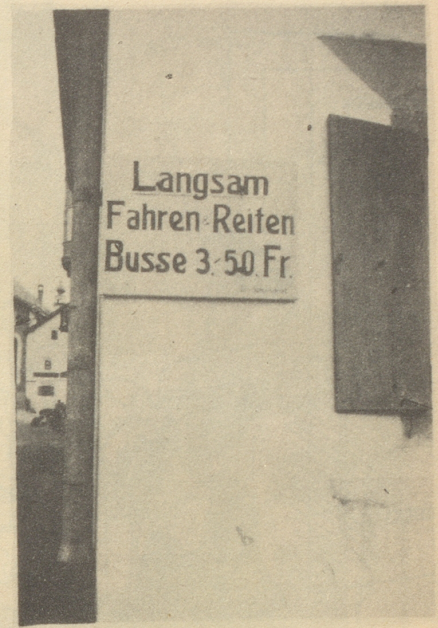
Da isch me schöö am Seil miteme alte Gaul!

Hei, ging da ein Aufschnauen durch die Mannen. Der Fourier schlug seine Absätze zusammen und kam mit seiner Schuhschachtel voll Sacksäcklein dahergerannt. Es ging nicht lange ... so hatte ich vier funkelnegeleue Fünfernötlein in der Hand. Jetzt aber los, wie die Kugel aus dem Rohr, zum nächsten Bäcker. Mit einem großen Sack voll Makrönli und Bretzeli und einem Nötlein weniger stieg ich bald wieder die ausgetretenen Stufen herunter und begab mich auf die Suche nach einem idyllischen Platz für meine Galgenmahlzeit. Diese wurde auf einer Holzbeige, plaziert zwischen einer Blumenwiese und einem Murbelbach, abgehalten. Genießerisch drückte ich die weißen, braunen und gelblichen Guetzli in