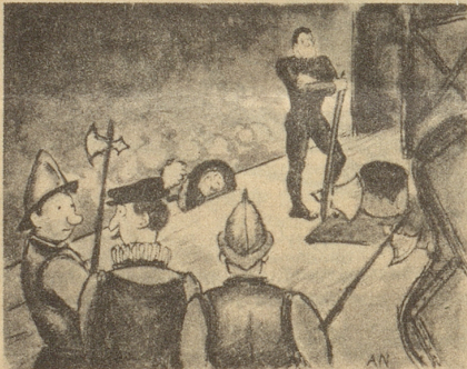
«Es ist mir schon ein wenig gruslig. Ich hatte nämlich heute vormittag noch Streit mit ihm.» Söndagsnisse Strix