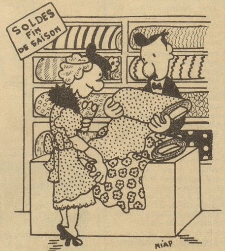
«Und wieviel darf es sein?» «Es sollen genau 4019 Tupfen sein ...» Söndagsnisse Strix

und von dem langen Warten erobst war, wollte sich über die Respektlosigkeit gegenüber dem angeschlagenen Fahrplan beim Kondukteur in gebrochenem Italienisch beschweren, worauf ihm dieser herzlich lächelnd repliziert: «Eh già — macht nüd —! koschfe glichvill.» Sc.