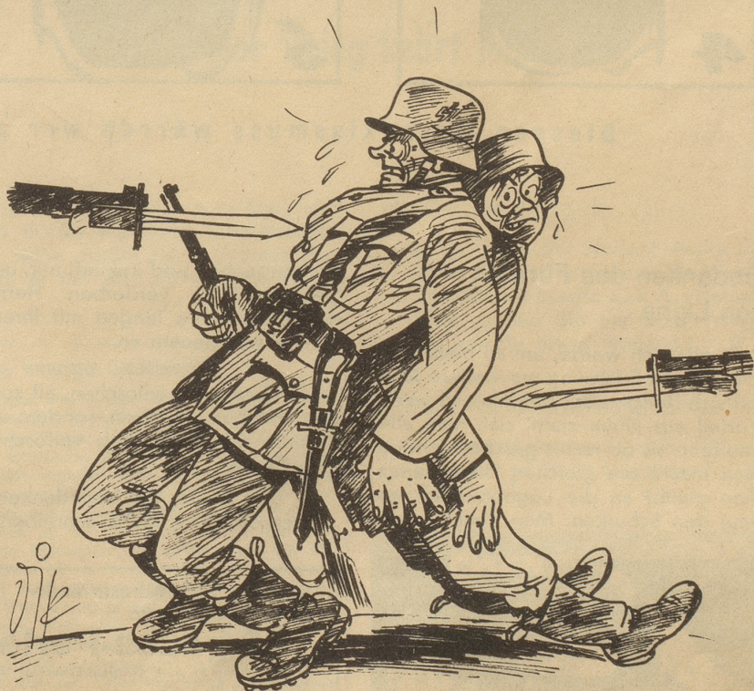
S. o. S.

Man spricht gerne von einem «Saubern Burschen», wobei das Wort «sauber» gerade das Gegenteil seines ursprünglichen Sinns bedeutet. Hamei