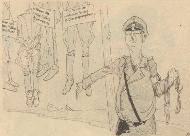
„Wir haben die Herrschaft in der Luft.“