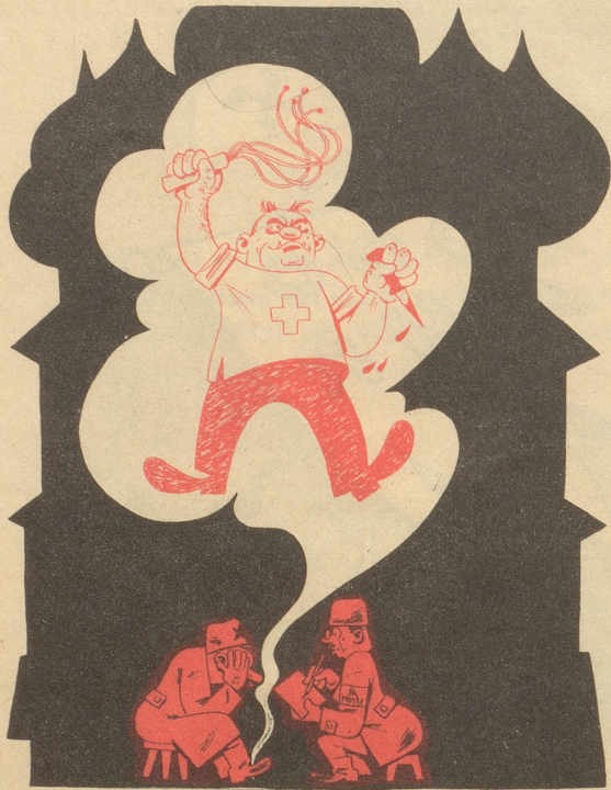
Der Orakler von Moskau diktiert einen Bericht über die Schweizer Gefangenenlager