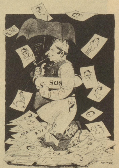
Die Bildredaktion im Mai 1945

Gott motivierte dies folgendermaßen: Wenn einer klug ist, und doch Na- tionalsozialist, dann kann er nicht ehrlich sein, ist er aber ehrlich und National- sozialist, dann vermag er nicht gleich- zeitig klug zu sein, ist er aber ehrlich und klug dazu, dan ist er bestimmt kein Nationalsozialist. Th. K.