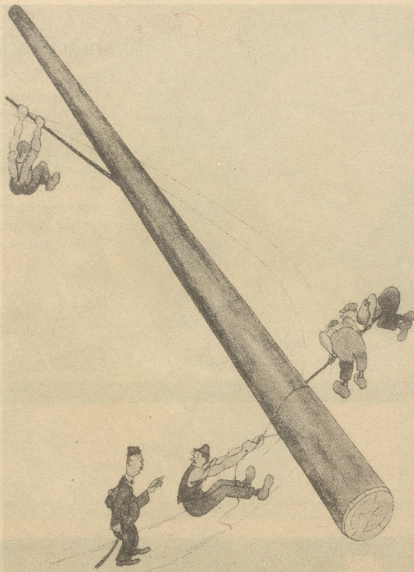
«Warum saged er en nüd abenand!» «Das git drum es Zahbürschfeli — aber de Näbelspalter-Redakter hät mir verbotte z'säge für wen!»