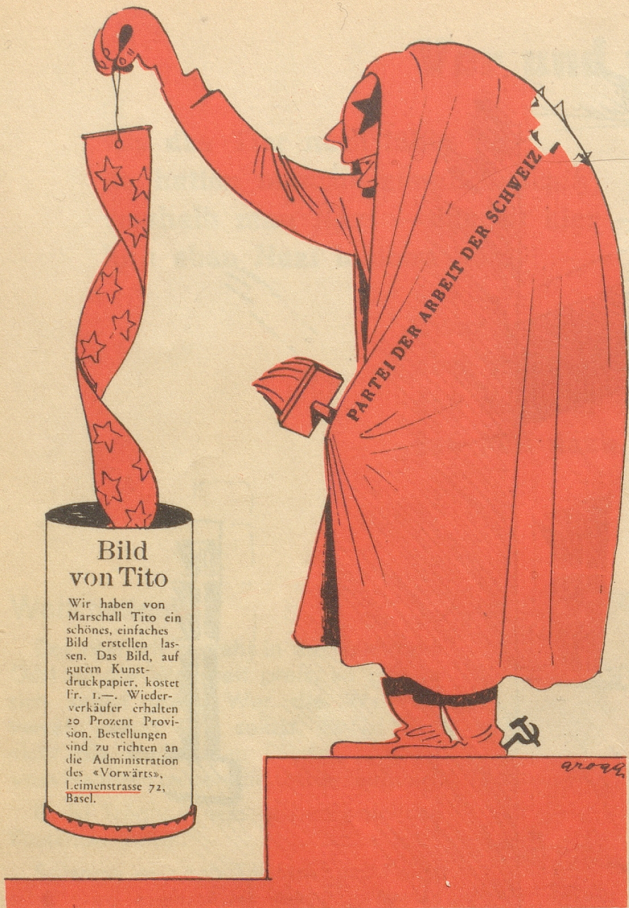
„Vorwärts! Wer kriecht auf den Leim der Leimenstrasse?“