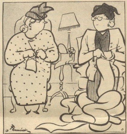
„Es schaudert mich beim Gedanken, daß ich diesen Strumpf wieder aufziehen muß.“ Illustrated