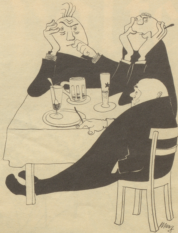
E Hampfle Müschterli us em H. D.