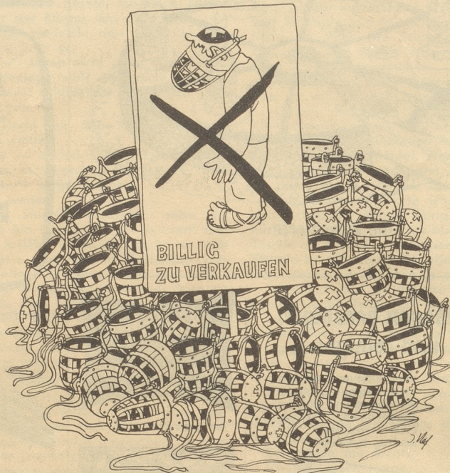
Im Zeichen der Abrüstung

Ihr geht von falschen Voraussetzungen aus. Bei den Nasen handelt es sich nicht um die gleichnamigen Fische, sondern um die Auswüchse, die die Menschen mitten im Gesicht tragen, die Nasen also, auf welche die Ziegel, wenn sie vom Dach fallen und nicht direkt den Kopf treffen, aufschlagen oder anstoßen. Und diese Ziegel, die den Kopf, auf den sie eigentlich fallen wollten, verfehlen, vielmehr auf der Nase landen, — die heißt man — Nasenziegel. Nasenziegel sind also Ziegel, die ihren Beruf, Leuten wie Euch auf den Kopf zu fallen, verfehlt haben und sich damit begnügen müssen, Euch einen kräftigen Nasen-