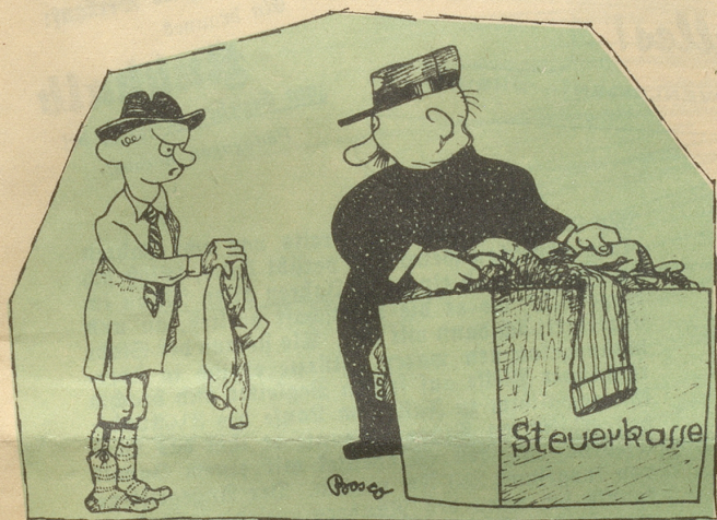
Nach dem Krieg zieht der Staat seine Bürger aus!