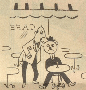
Savons, Chocolats, Cigarettes Américains.