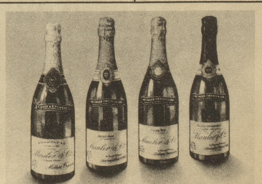
Mauler & Cie. au Prieuré St. Pierre Môtiers-Travers Schweizer Haus gegründet 1829

Krampfaderstrümpfe! Masskarte, Preisliste auf Wunsch F. Kaufmann Zürich Kasernenstrasse 11