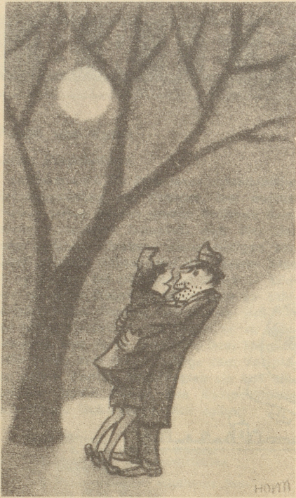
«Oh, du meine Rose ...» «Und du mein Kaktus!»