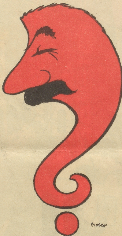
Das rote Fragezeichen

Nach einem noch unbestätigten Gerücht soll sich auch Winston Churchill in der Schweiz aufhalten. Jedenfalls glaubt man den einstigen Premier in