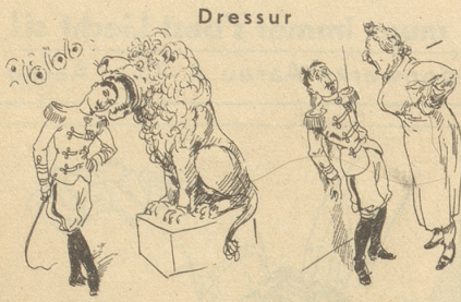
Dressur im Leben A und im Leben B. Söndagsnisse Strix