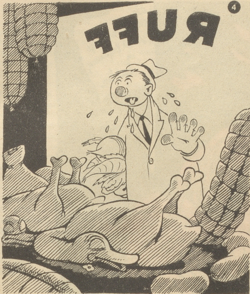
Die Versuchung des Vegetarianers