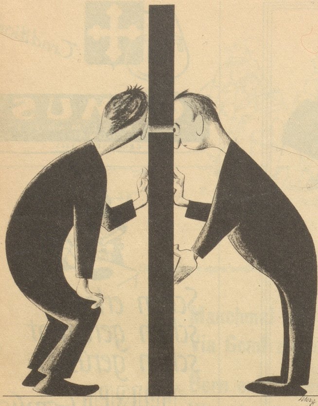
Ost und West oder das Mißtrauen